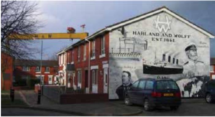
Belfast, die Werft „Harland & Wolff“ baute die Titanic

wartet mit zwei herausragenden, aus dem 9. Jh. stammenden Beispielen für Bibelhochkreuze auf. Abends: eine intensive musikalische Überraschung. Übernachtung in/bei Belfast.