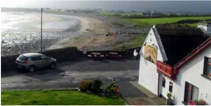
Sligo an der Atlantikküste