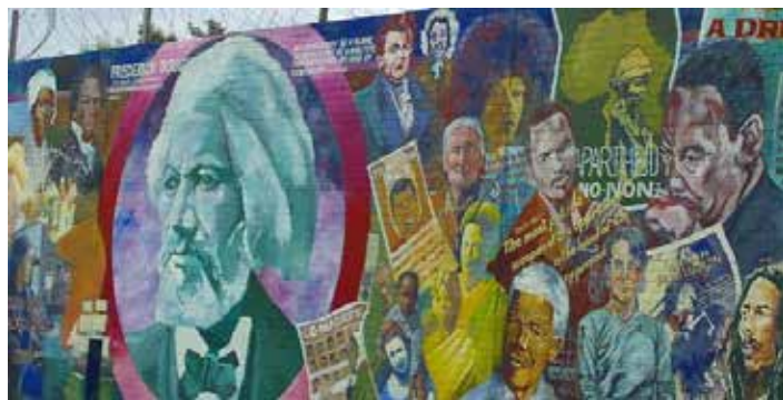
Mural in Belfast