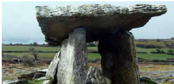
Poul nabrone Dolmen