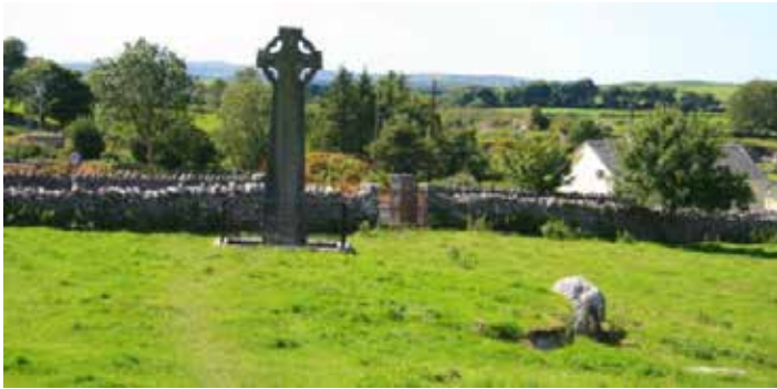
Ein keltisches Hochkreuz

blick in den Umgang Irlands mit seinen Sehenswürdigkeiten geben. Danach Besuch von Kilfenora mit seinem über 800 Jahre alten Doorty High Cross. Eine Besonderheit Kilfenoras: Es handelt sich um die einzige irische Gemeinde, die keinem Bischof, sondern direkt dem Papst unterstellt ist. Papst Franziskus ist somit genau