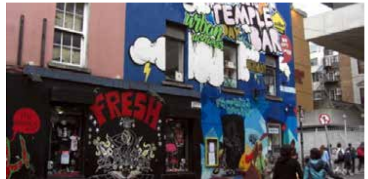
Dublin ist bunter geworden ...

Dublin total. Nach dem Frühstück machen wir eine Stadtrundfahrt mit anschließendem gemeinsamem Besuch des Kilmainham Jail. Das Gefängnis wurde 1796 erbaut. Viele Rebellenführer und nationalistische Politiker waren in Kilmainham inhaftiert, einige wurden hier hingerichtet. Nach der Unabhängigkeit Irlands